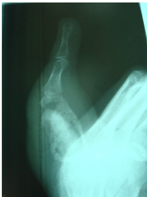
تصویر ۱: رادیوگرافی ساده انگشت پنجم دست چپ

در معاینه فیزیکی تنها فیستول در حال ترشح، تندرینس موضعی و تورم فالنکس دیستال انگشت پنجم وجود داشت. سایر معاینات فیزیکی نرمال بود. آزمایش خون تعداد لوکوسیت را ۷۸۰۰ با نوتروفیل ۶۴ درصد، لنفوسیت ۳۵ درصد، مونوسیت ۱ درصد نشان داد، CRP=۱۱/۸ mg/dl، ESR=۱۰ بود. تست‌های عملکرد کبد، آنالیز ادراری و تست‌های بیوشیمی